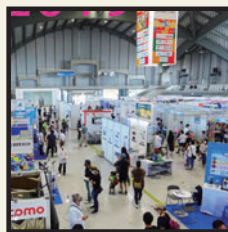
ResorTech EXPO (旧:ResorTech Okinawa おきなわ国際IT見本市) 開催