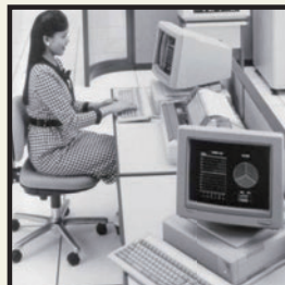
オフィスコンピュータの普及