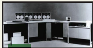
電子計算機の導入